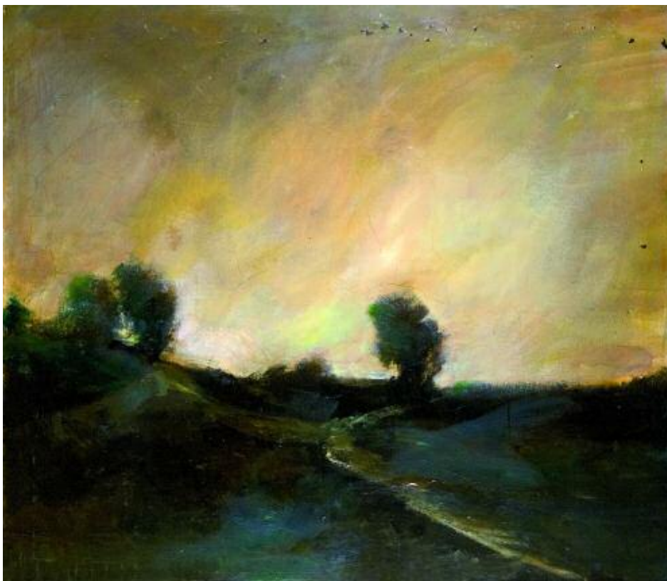
161 CIOBANU MIRCEA

161 CIOBANU MIRCEA, 1950-1991 [RO]. Campagne , huile sur toile (110 x 130 cm). CHF 2'500.- | 3'500.- € 1'550.- | 2'170.-