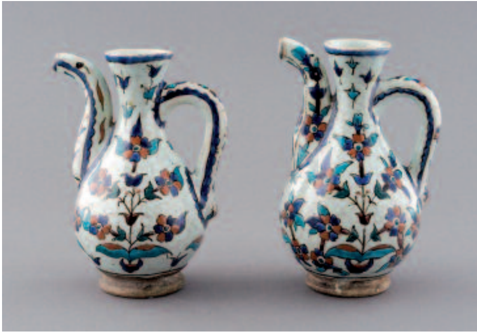
1493 PAIRE D'AIGUIÈRES OTTOMANES

1493 PAIRE D'AIGUIÈRES OTTOMANES, XVIIIe s., (H: 17 cm). En céramique à décor floral, peint en rouge et divers bleus, sur un fond d'engobe blanc. Quelques restaurations, notamment sur le bec. Provenance: collection J. Cristallidis, Genève. Ce lot a été examiné et décrit par Marc Edward Muller, Genève. CHF 3'000.- | 4'000.- € 1'860.- | 2'480.-