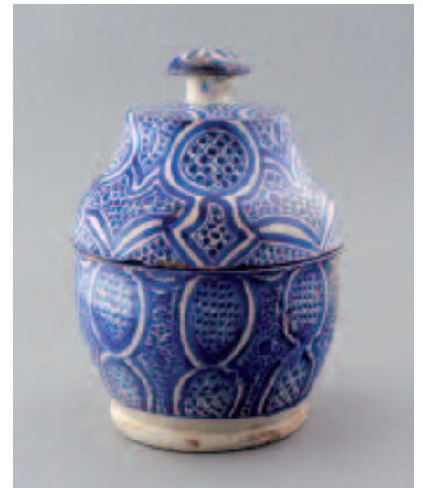
1513 RÉCIPIENT COUVERT «JOBANA»

1514 VASE EN FORME D'AMPHORE, Maghreb, XVIIIe-XIXe s., (H: 34.5 cm).