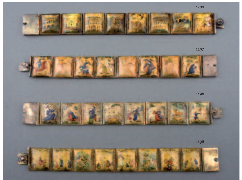
1496, 1497, 1498, 1500

1496 BRACELET ÉMAILLÉ, Zand ou Qadjar, Perse, fin XVIIIe-début XIXe s., (L: 19.4 cm). Composé de huit pièces en os dans une monture d'argent articulée. Décor de personnages, de scènes de chasse et d'animaux. Provenance: collection J. Cristallidis, Genève. Ce lot a été examiné et décrit par Marc Edward Muller, Genève. CHF 700.- | 900.- € 430.- | 560.-