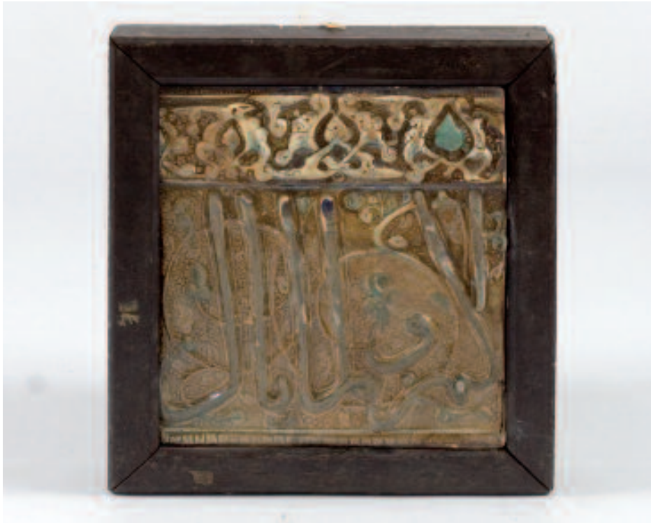
1507 CARREAU DE FAÏENCE

1507 CARREAU DE FAÏENCE, fragment de frise de mosquée, Kashan, Perse, XVIe-XVIIe s., (35 x 38.5 cm).