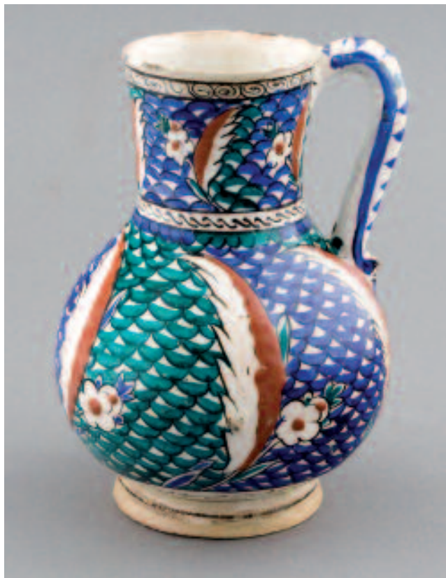
1470 PICHET SUR PIÉDOUCHE