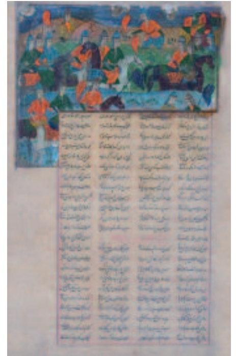
1511 ENLUMINURE PERSANE ENCADRÉE