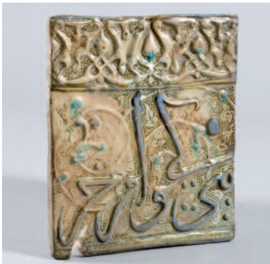
1506 CARREAU DE FAÏENCE