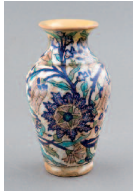
1495 VASE OTTOMAN

1495 VASE OTTOMAN, ca XVIIIe s., (H: 19 cm). Motifs floraux polychromes, sur un fond d'engobe blanc. Quelques restaurations, notamment sur le col. Provenance: collection J. Cristallidis, Genève. Ce lot a été examiné et décrit par Marc Edward Muller, Genève. CHF 1'000.- | 1'500.- € 620.- | 930.-