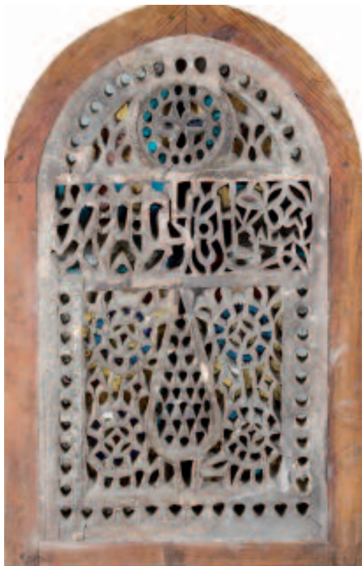
1487 VITRAIL OTTOMAN

1489 CARREAU DE FAÏENCE OTTOMAN , ca XVIIIe s., (L côté: 10 cm, L hors tout: 19.2 cm). Motif floral bleu sur fond d'engobe blanc, sous glaçure transparente. Forme hexagonale. Provenance: collection J. Cristallidis, Genève. Ce lot a été examiné et décrit par Marc Edward Muller, Genève. Image visible sur www.art-auction.ch CHF 600.- | 800.- € 370.- | 500.-