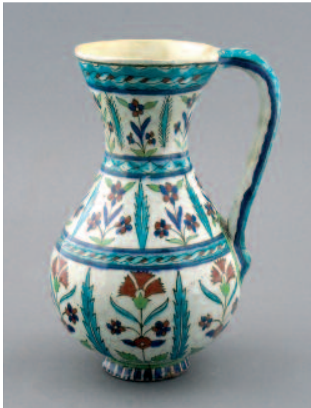
1472 CRUCHE IZNIK

1472 CRUCHE, IZNIK, XVIe-XVIIe s., céramique (H: 26 cm). Décor peint de motifs floraux (bleu, rouge et vert) sur un fond d'engobe blanc, sous glaçure transparente. Importantes restaurations, notamment sur le col. Provenance: collection J. Cristallidis, Genève. Ce lot a été examiné et décrit par Marc Edward Muller, Genève. CHF 2'500.- | 3'500.- € 1'550.- | 2'170.-