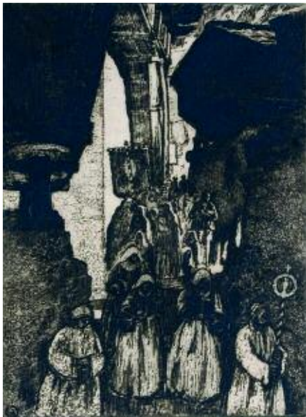
536 VALLET ÉDOUARD EUGÈNE FRANÇOIS

537 VALLET ÉDOUARD EUGÈNE FRANÇOIS, 1876-1929 [CH]. «Profil», 1911, pointe sèche et burin sur zinc (21 x 17,5 cm). Signé au crayon dans la marge b. d. et intitulé dans la marge b. g. Bibliographie: CR Giroud, no 50, p. 147. CHF 2'500.- | 3'500.- € 1'550.- | 2'170.-