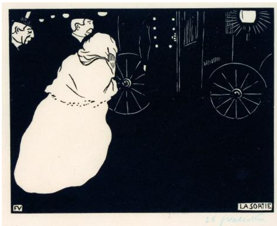
557 VALLOTTON FÉLIX ÉDOUARD