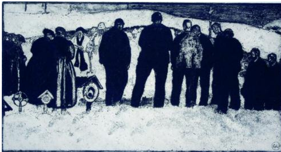
540 VALLET ÉDOUARD EUGÈNE FRANÇOIS

540 VALLET ÉDOUARD EUGÈNE FRANÇOIS, 1876-1929 [CH]. «Enterrement à la montagne», 1913, eau-forte et pointe sèche sur zinc (22,8 x 44,5 cm). Signé dans la marge b. d., monogrammé dans un cercle dans la plaque b. d., intitulé au fond de la marge b. g. Bibliographie: CR Giroud, no 57, p. 148. CHF 4'000.- | 5'000.- € 2'480.- | 3'100.-