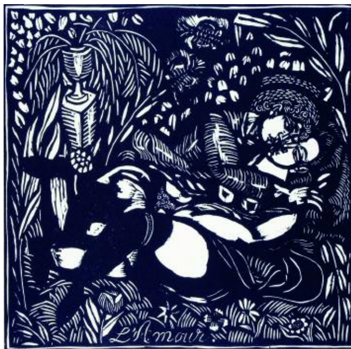
10 DUFY RAOUL