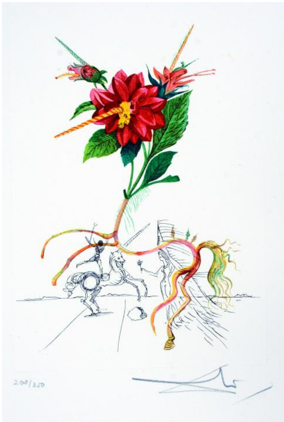
56 DALÍ SALVADOR