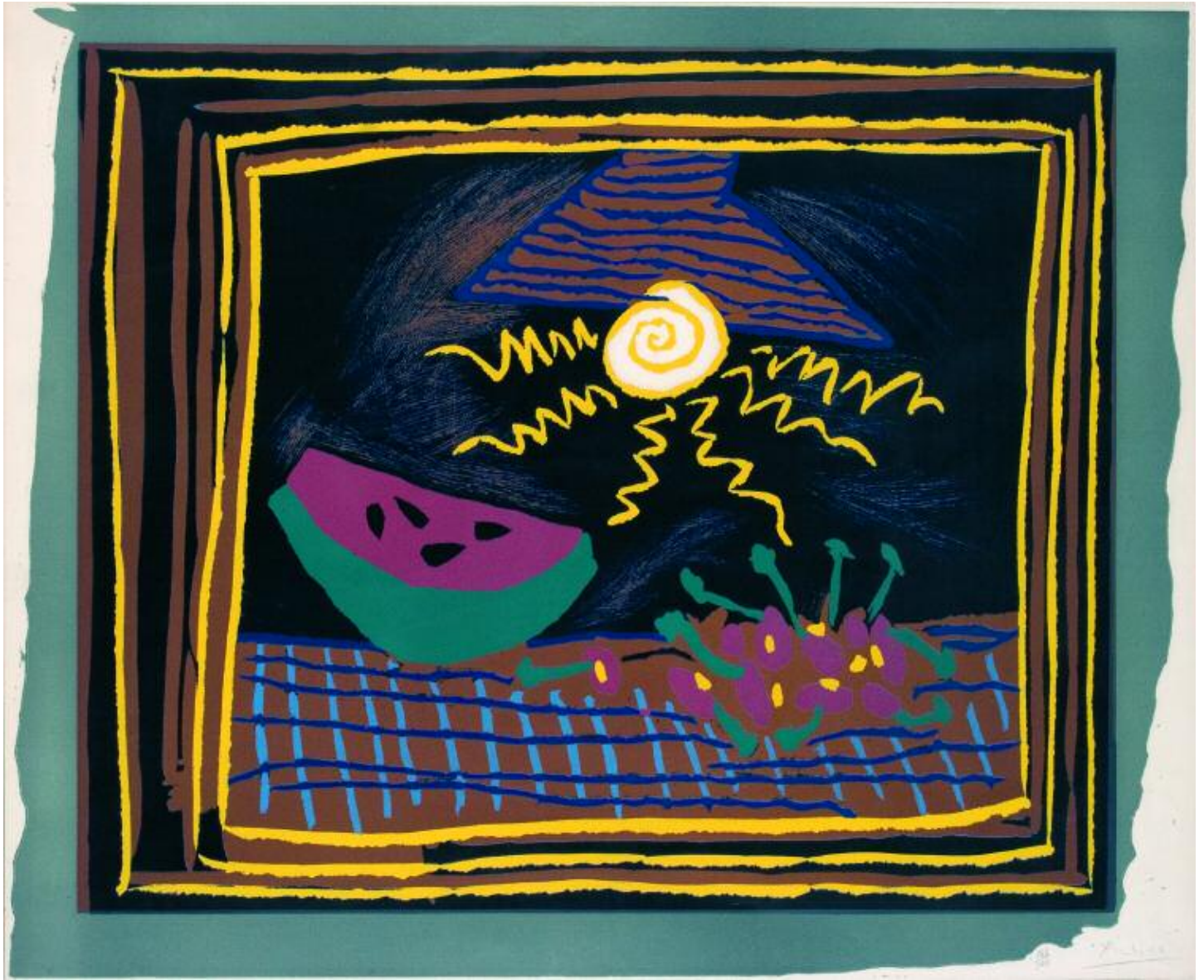
26 PICASSO PABLO